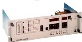
MPS 8043 15 Zeiten bis zu 100 Programme