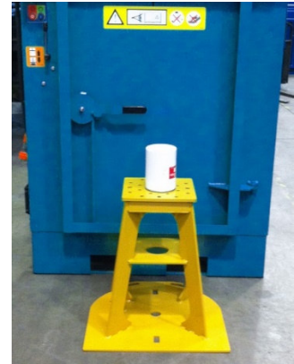
Presseinsatz für Öl-Filter