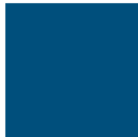
Standard-Maschinenfarben nach RAL ohne Aufpreis