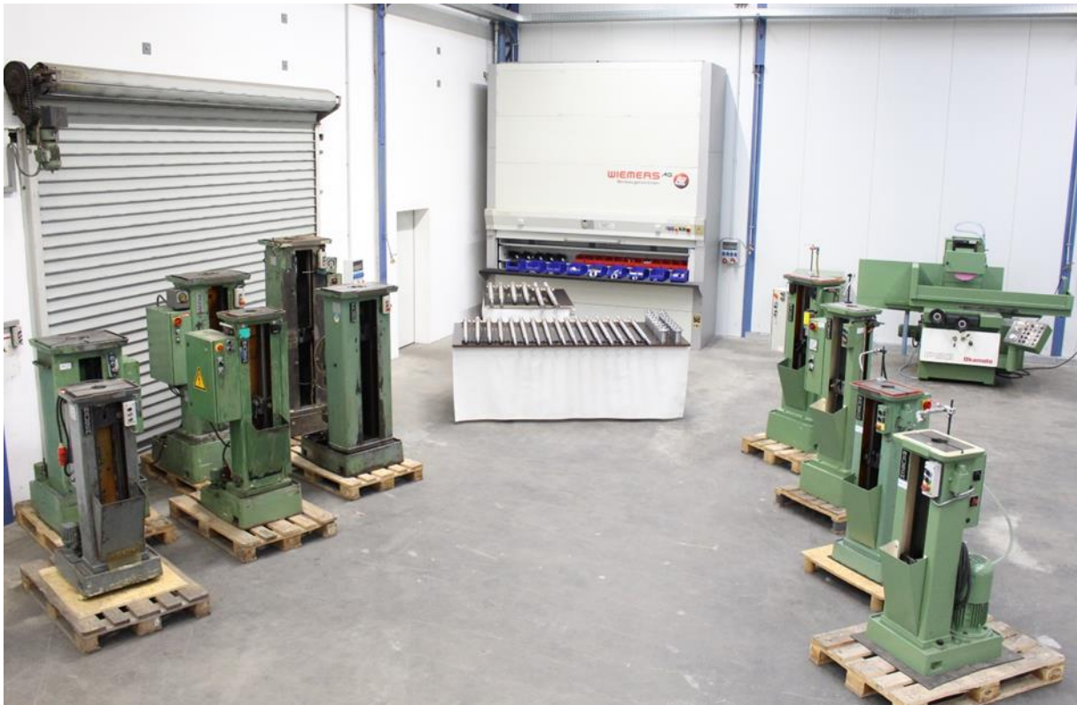
Bild mit gebrauchten Rausch Senkrechtäummaschinen (linksseitig ungeprüft & rechtsseitig instandgesetzt), und einem Auszug von diversen am Lager befindlichen Ersatzteilen wie Antriebsspindeln, Spannbacken, Lagertöpfen ..usw. Auch Zukaufteile wie Zahnriemen und Kühlmittleinrichtungen, sind zum Großteil ab Lager lieferbar.

Wir überprüfen die gebrauchten Rausch Maschinen und können diese bei Bedarf in verschiedenen Varianten instandsetzen. Dies kann von der einfachen Reparatur, dem Austausch der Verschleißteile, bis hin zur Generalüberholung mit „CE“ Kennzeichnung erfolgen.