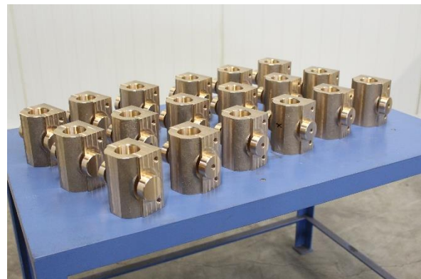
Bild mit fertig bearbeiteter Außenkontur der Spindelmutter für die Baugröße RS 3 ohne das Trapezgewinde (wird auf die Mutter angepasst)