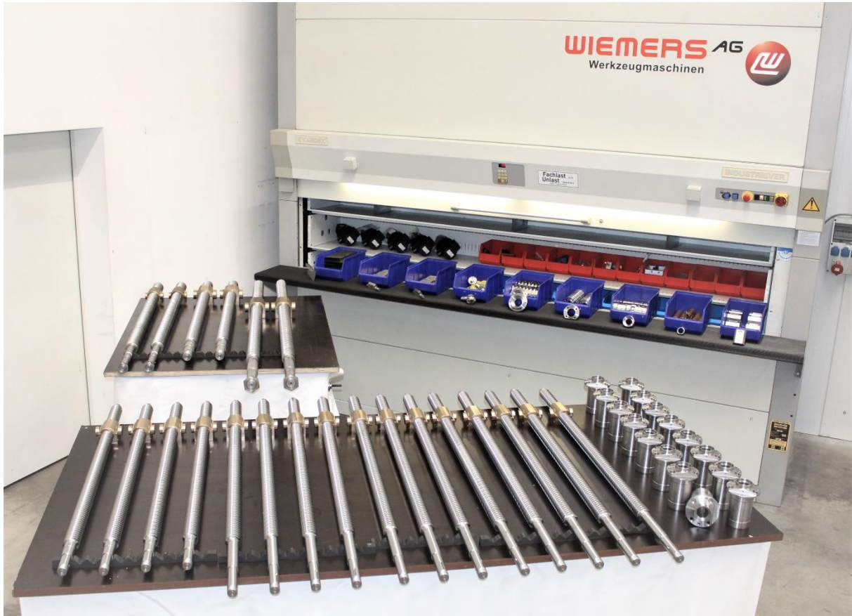
Lagerpaternoster mit diversen Ersatzteilen und neuen Antriebsspindel für die verschiedenen Maschinenvarianten und Leistungsgrößen