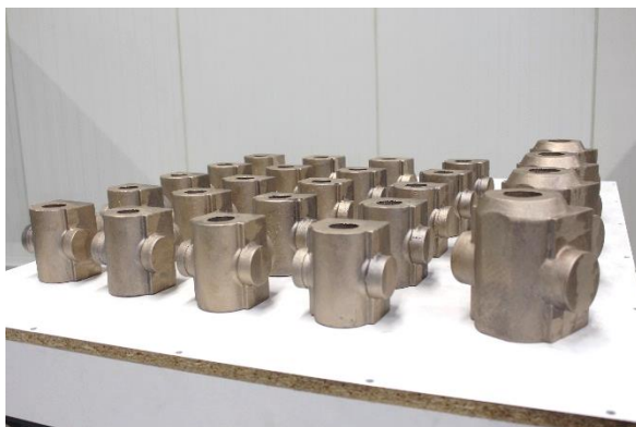
Bild mit diversen gegossenen Spindelmutter für die Maschinen der Baureihe RS 3 und RS 6