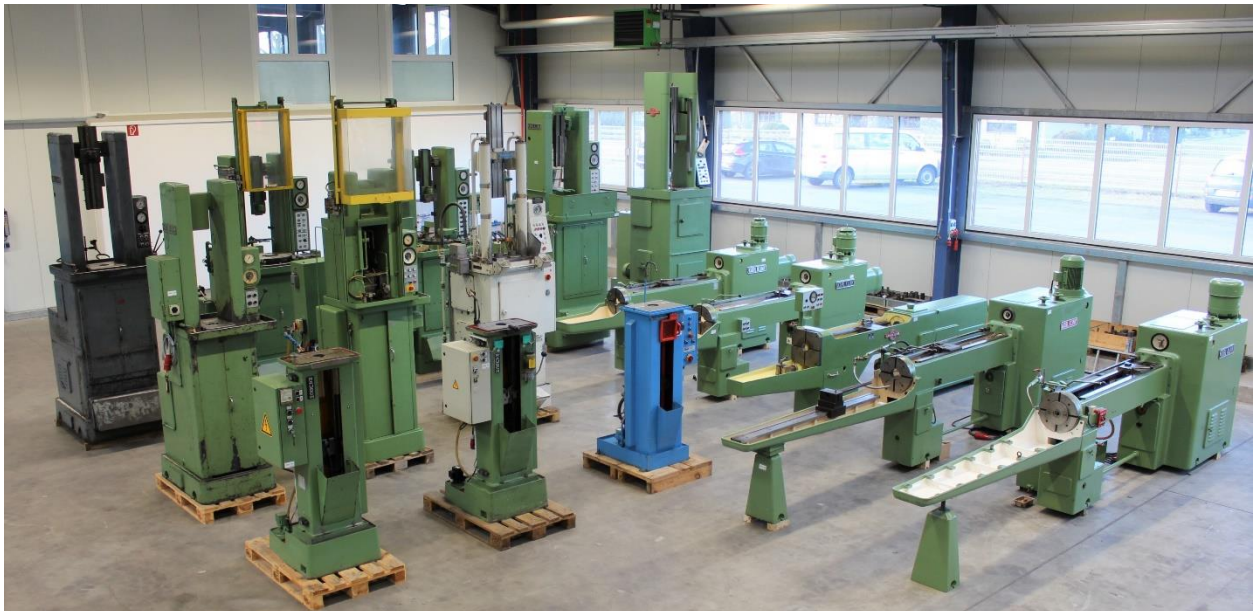
Bild aus unserem Gebrauchtmaschinen Lager, mit horizontalen und vertikalen Maschinen bis 16.000 kg Zugkraft

Wir sind vom Hause ein Lohnräumbetrieb und können Ihnen auch bei technischen Fragen aus 50-jähriger Erfahrung in der Räumtechnik behilflich sein.