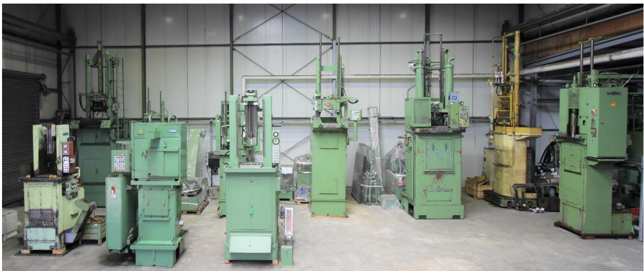
Bild aus unserem Gebrauchtmaschinen Lager, mit vertikalen Maschinen bis 63.000 kg Zugkraft