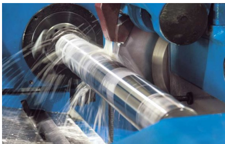
Nachschleifen mit rotierendem Werkstück