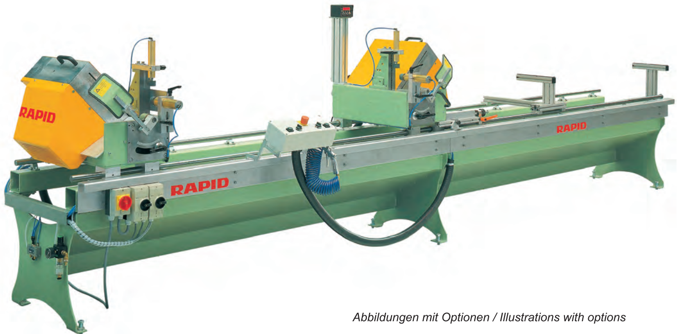
Abbildungen mit Optionen / Illustrations with options